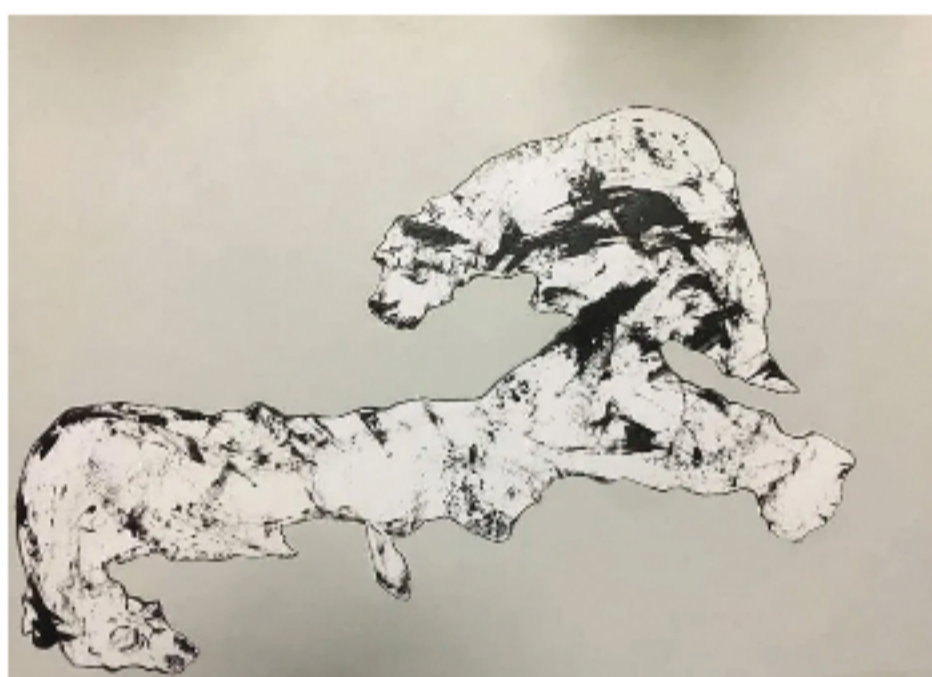
DE LA EXHIBICIÓN «GRIS» DEL ARTISTA CALIN DOVER TARRATS.

a una figura que parece huir. En esta muestra, el gris de Calin Dover Tarrats no es neutral. Es un gris tedioso, angustiado, el gris que cargamos a diario, ese gris de estar hartos de que tomen las decisiones por nosotros.